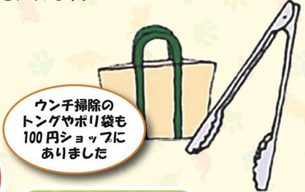
ウンチ掃除の トンクやポリ袋も 100円ショップに ありました