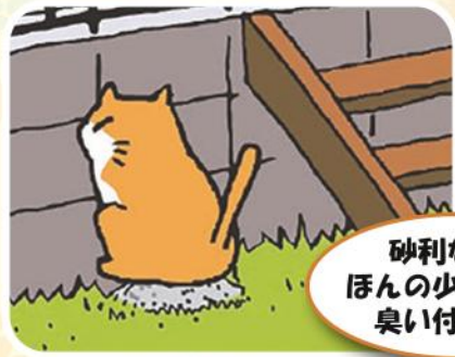
砂利などをほんの少し盛って臭い付けを…