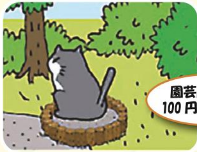
園芸用の柵を100円ショップで